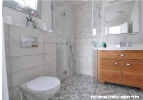
חדרי רחצה. עיצוב אורנה עדן