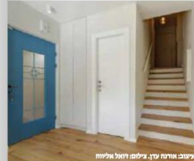
עיצוב אורנה עדן

"בשנה וחצי האחרונות הצבע הכחול חזר לאופנה. אפשר להגיד שזה בהשראה ים תיכונית. בשנות העשרים ראינו את הצבע בא לידי בסגנון יומולדת שבעים, במקרה או שלא במקרה, אחד משמנות הצבעים בטרנדים לעיצוב הבית הוא כחול טהור. לכן גם בעתיד הקרוב נמשך לראות עיצובים בכחול בכל מקום. השאלה אם אתם מספיק אמיצים לשלב אותו אצלכם בבית. בשנה וחצי האחרונות הצבע הכחול חזר לאופנה. אפשר להגיד שזה בהשראה ים תיכונית. בשנות העשרים ראינו את הצבע בא לידי בסגנון יומולדת שבעים, במקרה או שלא במקרה, אחד משמנות הצבעים בטרנדים לעיצוב הבית הוא כחול טהור. לכן גם בעתיד הקרוב נמשך לראות עיצובים בכחול בכל מקום. השאלה אם אתם מספיק אמיצים לשלב אותו אצלכם בבית. משלבים כחול בעיצוב הבית? "אם זה כחול כהה לא לשלב אותו עם צבע שחור. לצורך העניין, תכלת, דווקא משתלב עם שחור, ואפילו עם שילוב של שחור-לבן. צריך להתייחס לגוון ולדעת לשלב את זה נכון". איזה תאורה מתאימה לעיצוב חדר עם פריטים כחולים? "כחול משתלב טוב עם תאורה לבנה ועם תאורה צהובה, זה תלוי בגוון של הכחול. לכחול בהיר אפשר להתאים תאורה טיפה צהובה, ולכחול כהה, מתאימה תאורה יותר לבנה. ככל שהכחול יותר כהה, צריך תאורה יותר בהירה". יש דבר כזה יותר מידי כחול? "כן. אם נוצעים יותר מידי קירות. לא כדאי להגשים כי זה יכול להיות צבע מדמם אם הוא מגיע במינונים גבוהים מידי". על מה מומלץ לשים לב כאשר